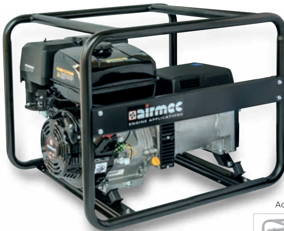
Accessorio - Accessory